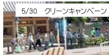
5/30 クリーンキャンペーン