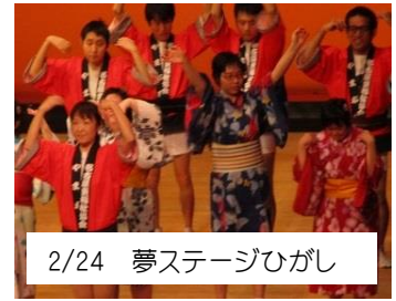
2/24 夢ステージひがし