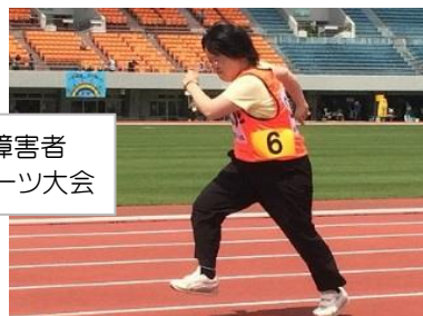
5/5障害者 スポーツ大会